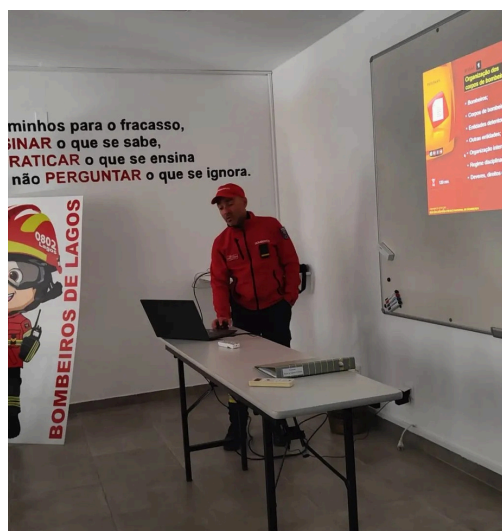
UFCD 9876 Organização do serviço de bombeiros

Este curso é composto por várias Unidades de Formação de Curta Duração UFCD - certificada pela Escola Nacional de Bombeiros.