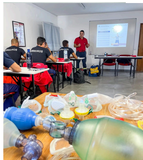
UFCD (8530 e 8531) Curso de Tripulante de Ambulancia de Transporte