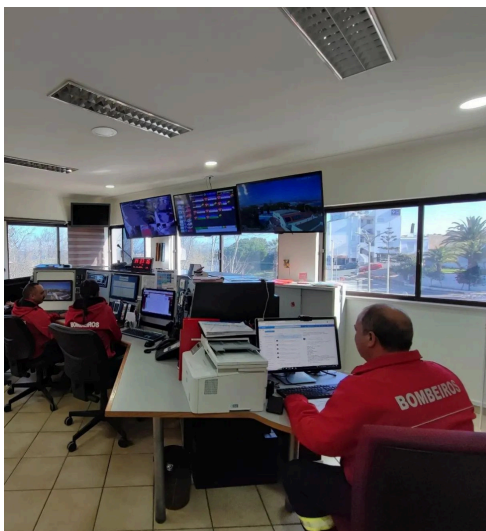
UFCD 9877 Tecnologias de base na atividade de bombeiro