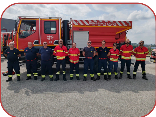
GRIR 01 ALGARVE

Ao entrar no nível Charlie o efetivo fica reduzido a 1 equipa que até ao dia 15 irá assegurar a resposta aos Incêndios Rurais no nosso concelho