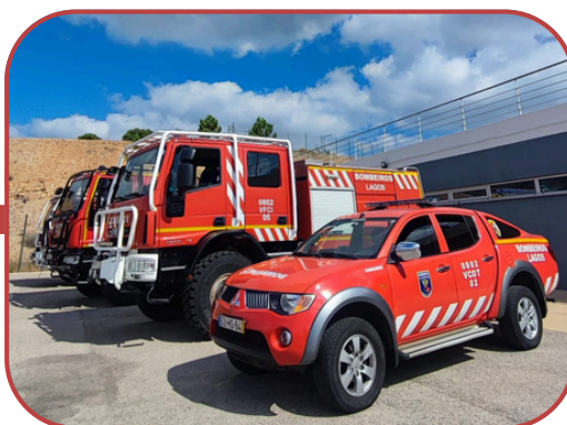
BCIN 02 BARLAVENTO