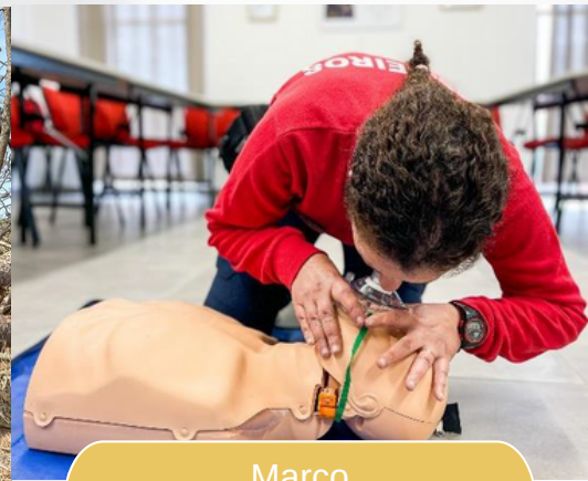
Março Emergência Pré-Hospitalar