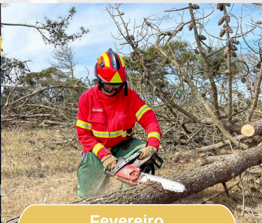
Fevereiro Incêndios Rurais