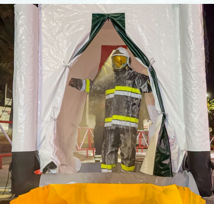
Abril Matérias Perigosas