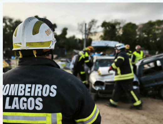
Maio Salvamento e Desencarceramento