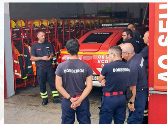
Junho Organização e Gestão de Operações