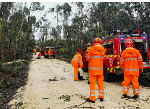
CORTE DE ÁRVORES

Esta participação permitiu-nos contribuir de forma ativa nas ações de bombagem, desobstrução e apoio às populações afetadas, demonstrando mais uma vez a solidariedade e a capacidade de resposta das corporações algarvias perante situações de emergência nacional.