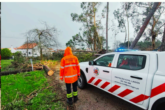
RECONHECIMENTO E AVALIAÇÃO