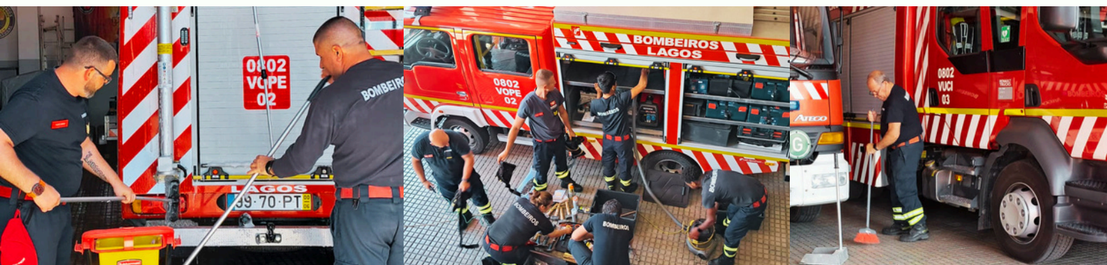
LIMPEZA DE VEÍCULOS

Como exemplo deste compromisso diário, destacamos a imagem dos nossos Bombeiros durante a lavagem de veículos e de reparação de equipamentos danificados, uma das muitas operações de manutenção que garantem que todo o nosso material está sempre operacional e pronto a ser usado em segurança.