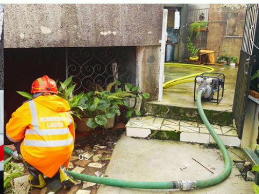
BOMBAGEM DE ÁGUA